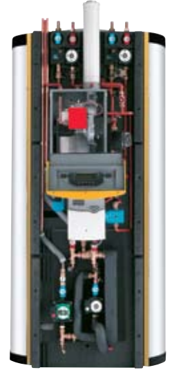
QUADRODENS DUC 750