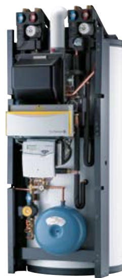
QUADRODENS DUC 500